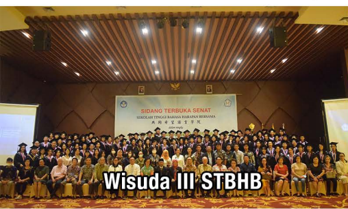
Wisuda III STBHB