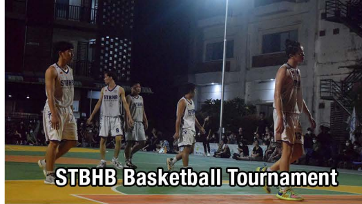
STBHB Basketball Tournament