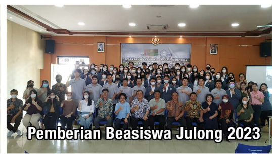
Pemberian Beasiswa Julong 2023