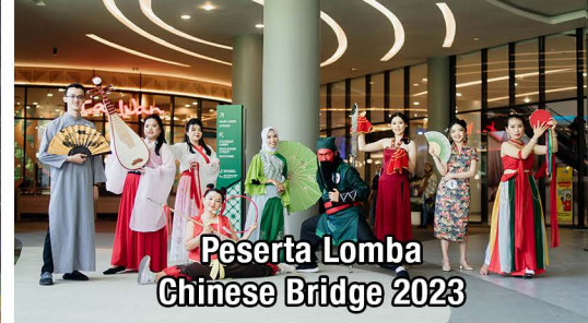
Peserta Lomba Chinese Bridge 2023

Bahasa merupakan kunci jendela dunia, salah satunya sebagai jembatan komunikasi antar bangsa. Dengan menguasai bahasa maka wawasan kita akan semakin luas, kesempatan penguasaan IPTEKS terbuka lebar dan dengan berjalannya waktu, kualitas hidup pun akan terus meningkat. Bahasa yang terbanyak penuturnya di dunia saat ini adalah bahasa Mandarin dan merupakan salah satu bahasa resmi Perserikatan Bangsa-Bangsa.