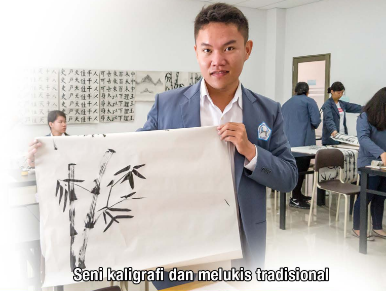
Seni kaligrafi dan melukis tradisional