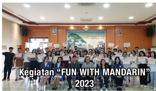
Kegiatan "FUN WITH MANDARIN" 2023