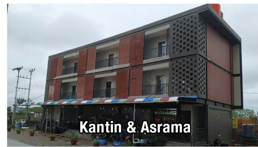
Kantin & Asrama